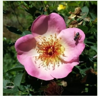
Rosa pimpinellifolia Frühlingsmorgen