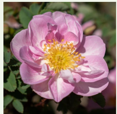
Rosa pimpinellifolia Mon Amie Claire

roze - landschapsstruikroos 50-100 cm middelsterkte, goed waarneembare geurige roos - geurbeschrijving niet beschikbaar Robert Brown