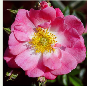
Rosa moyesii 'Eos'

wit - landschapsstruikroos 150-200 cm krachtig, langdurig geurende roos - geuomschrijving niet beschikbaar -